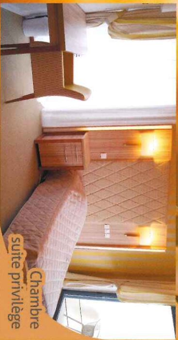
Chambre suite privilégiée